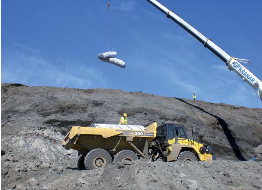
Anlieferung des TECCO® G65/4 Geflechts