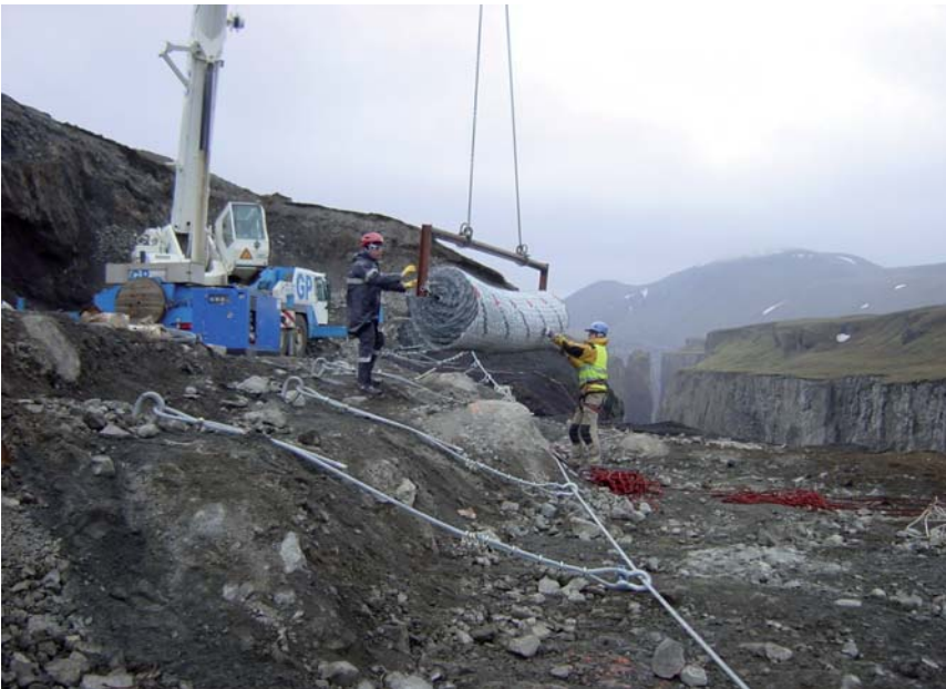
Positionierung der ersten Rolle TECCO® G65/4, Rollenlänge: 50 m