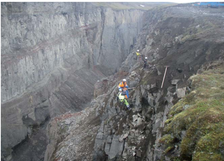
Um die Sicherheit für die Arbeiter beim Bau des Rückhaltedamms zu erhöhen, wurde zuerst eine Felsräumung durchgeführt