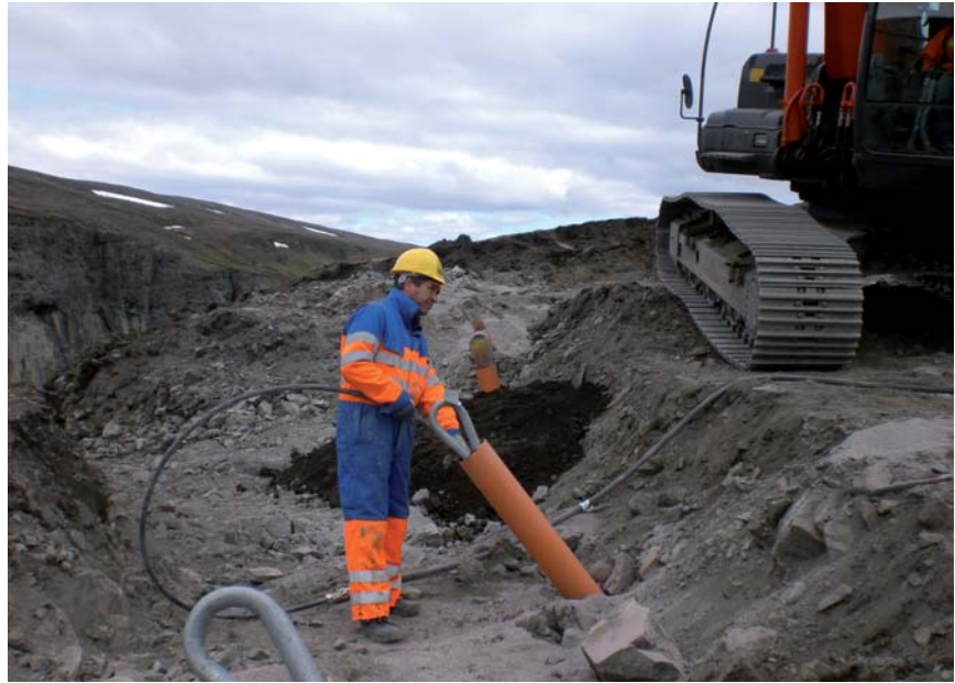
Installation der Seilanker in einer Reihe von je 70 Metern