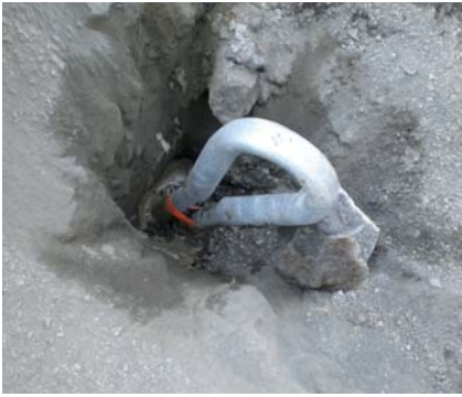
Seilanker Stärke: 22.5 mm Länge: 6 m