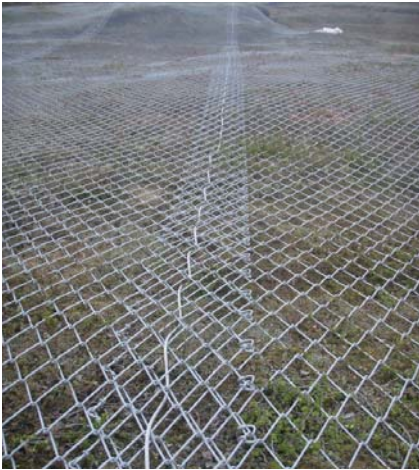
Aufgrund der schlechten Felsgegebenheiten und des steilen Geländes wurden 3 Rollen mittels eines Nähseils verbunden und mit einem grossen Telekran installiert.