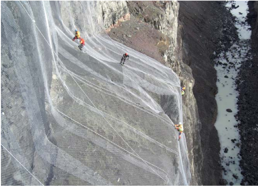
Jede Geflechtsbahn wurde mit einem 22 mm starken Seil verstärkt, Netz und Seil wurden in jeweils 2 m Abstand mit Seilklemmen verbunden.