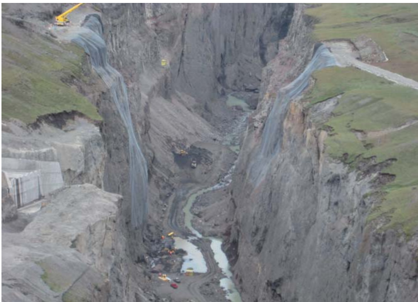
Durch TECCO® Steinschlag-Vorhang gesicherte Baustelle für den Rückhalte-damm