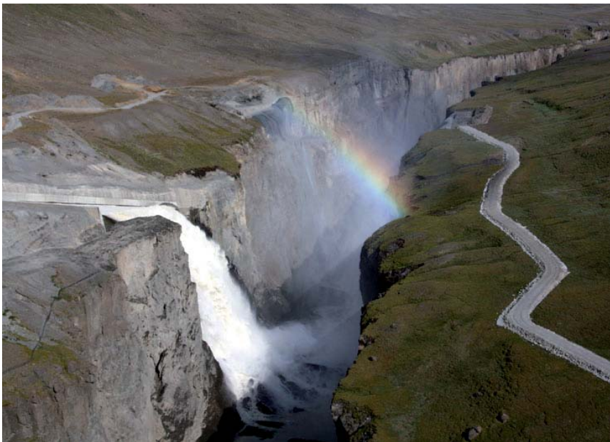
Der Überlauf des Stausees stürzt als Wasserfall ca. 120 m in den Canyon