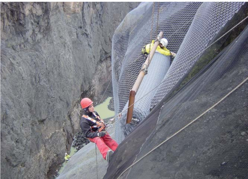
Spezielle Abroll-Vorrichtung zum Anbringen der Geflechtbahnen