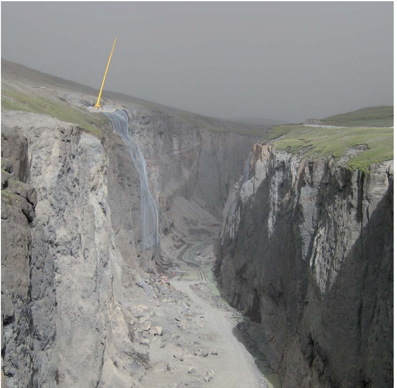
Temporärer Steinschlag-Schutz, Kárahnjúkar Wasserkraftwerk Projekt, Island